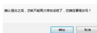
图 2-8 成绩提交时提示页面

成绩提交后，自动切换到成绩查看页面，可以点击页面下方的“打印”按钮打印成绩单，也可以点击“返回”按钮返回图 2-9 的任课教师课程成绩管理页面，课程的“操作”栏显示更新为“打印成绩”。点击“打印成绩”链接任课教师可以查看和打印学生成绩单。