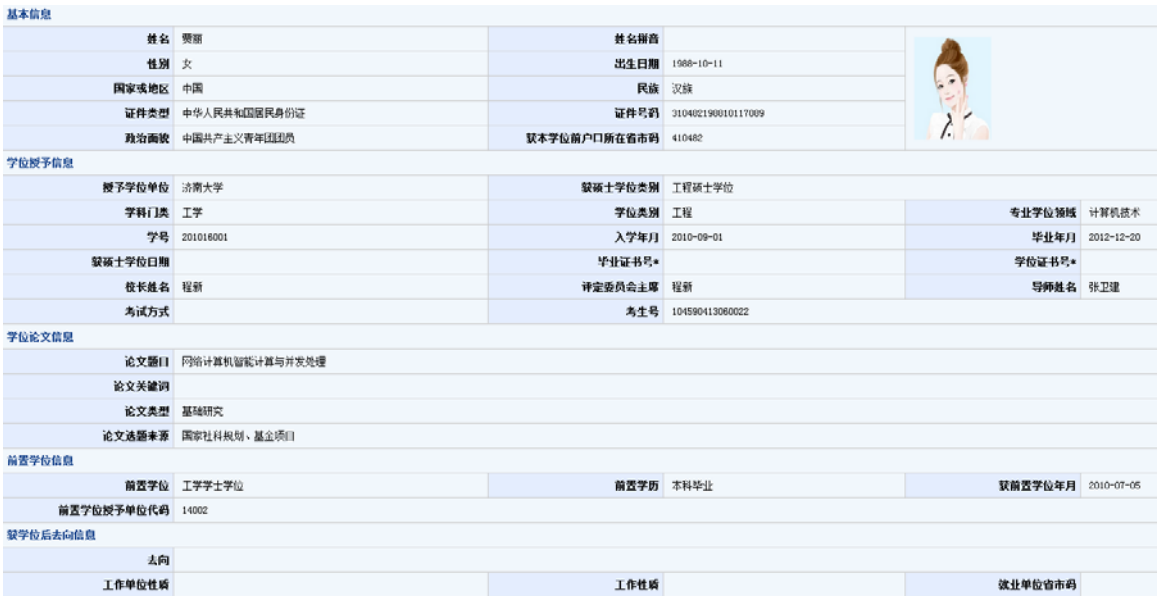
图 3-4 学生学位详细信息显示页面